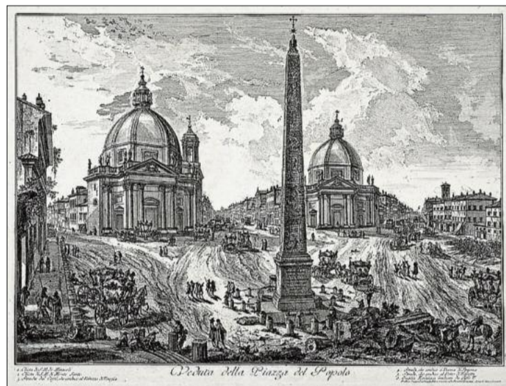
L'italià Giovanni Battista Piranesi és un dels grans artistes de gravat del segle XVIII. En aquest, va recrear la Piazza del Popolo de Roma