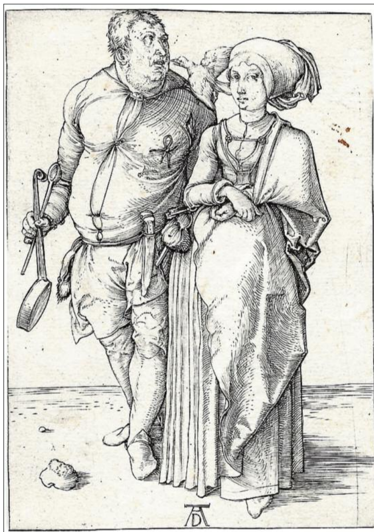
Albrecht Dürer és l'autor del gravat «El cuiner i la seva dona» (1496)

El renom de l'artista, la raresa de l'obra, l'estat de conservació i la qualitat de la impressió són aspectes que fan pujar el preu d'un gra-