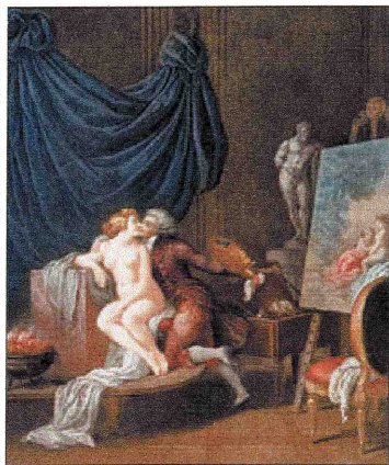
►► Le modèle disposée (1790), de Alexandre Chaponnier.

EL CERCLE SANT LLUC EXHIBE GRABADOS ANTIGUOS SOBRE EL TRABAJO ARTÍSTICO