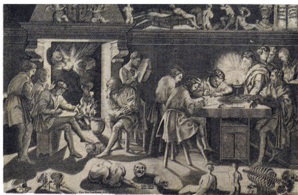
Enea Vico a partir de Baccio Bandinelli, L'Acadèmia de Baccio Bandinelli , c. 1550. Burí, 310 x 480 mm

Professor d'Història de l'Art a la Universitat de Barcelona i expert en gravat