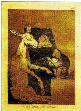
El gravat de Goya de l'exposició